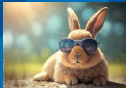
Velikonoční výstava str. 3