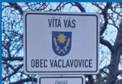
Info starosty obce str. 2