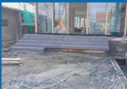
Rekonstrukce OÚ str. 3