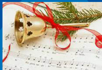
Vánoční koncert str. 9