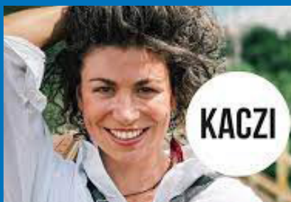
Koncert Kaczi str. 6