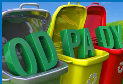
Odpady str. 2