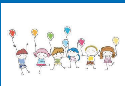
Dětské radovánky čtěte na str. 2