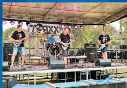
Václavovické rockle čtěte na str. 2