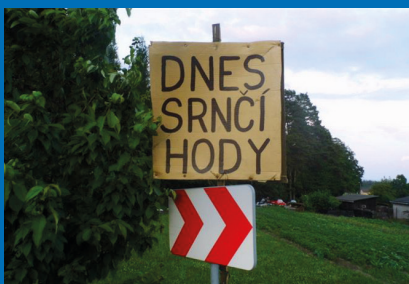
Srnčí hody čtěte na str. 2