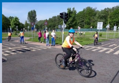
Cyklisté v rušném provozu čtěte na str. 7