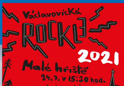
Václavovická ROCKLE čtěte na str. 5