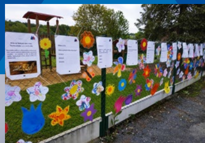
Den včel čtěte na str. 8