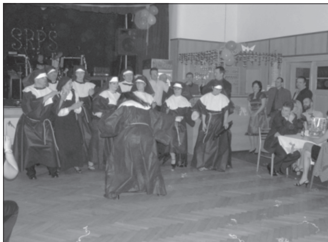
I tato fotografie z naší akce dokazuje, že jsme se velmi dobře bavili.