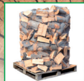
packfix 1,6m3 PRMS