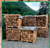
ukládáné v paletě 1m3 PRM